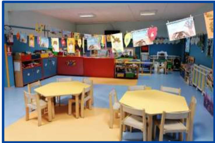
LA SEZIONE DEI BLU

La sezione è il luogo di riferimento in cui il bambino trascorre la maggior parte della giornata.....l'ambiente deve essere ben curato ed accogliente