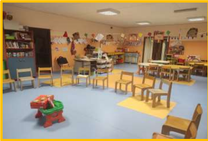
LA SEZIONE DEGLI ARANCONI

La nostra scuola è composta da due sezioni